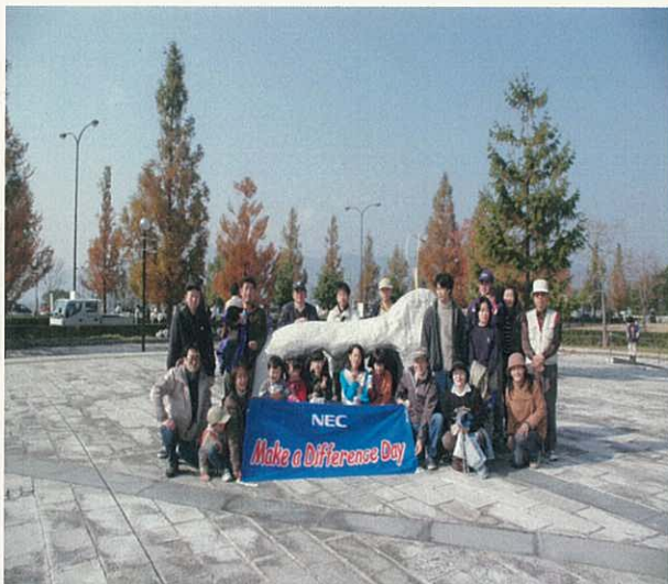
H16.11.25 烏丸半島周辺清掃（自主企画）