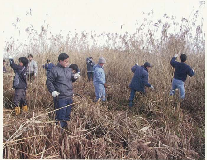
H17.1.30 琵琶湖ヨシ刈り（大津市主催）