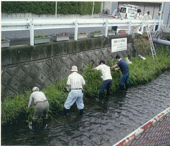
H16.6.27 盛越川清掃（自主企画）